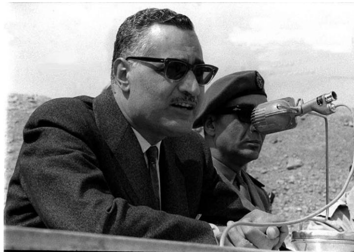
زيارة عبد الناصر للجبهة في ثانيا وثالث أيام عيد الاضحى ١١/٣/١٩٦٨

واقترح بومدين، توسيع الصلات السوفيتية الجزائرية في مجالى العلم والثقافة.