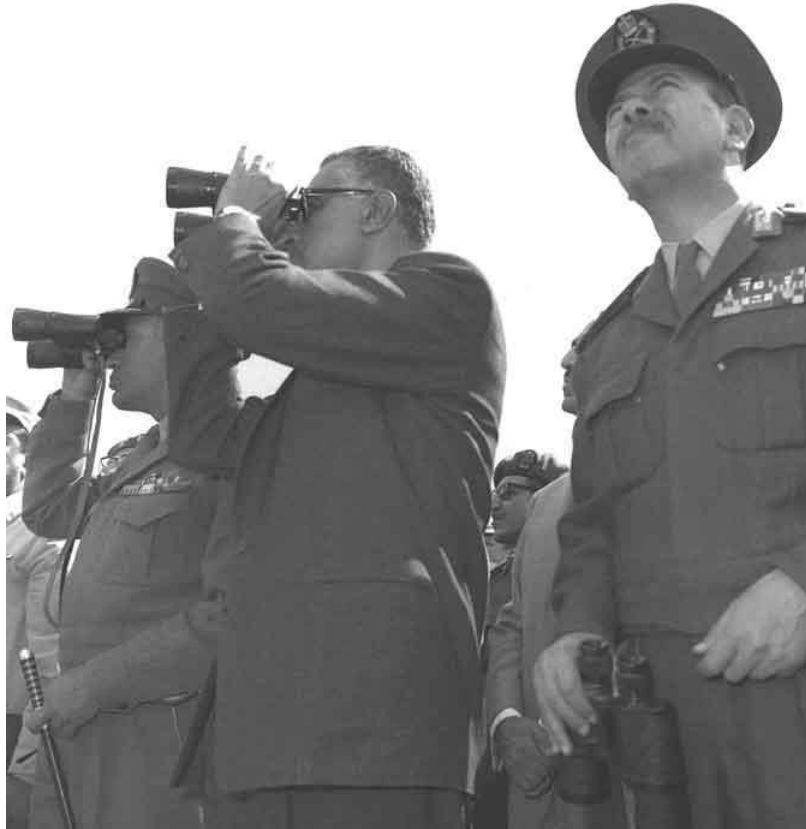
عبد الناصر يشهد عملية تدريب عسكري ١٩٦٨/٣/٥

وفي الظروف الحالية، فإن الحكومة السوفيتية تعبر مرة أخرى عن رأيها؛ أن الولايات المتحدة الأمريكية بوسعها ممارسة التأثير اللازم على اسرائيل، وذلك حتى يتم تنفيذ قرار مجلس الأمن في ١١/١١/١٩٦٧ بأسرع وقت ممكن، وحتى يتحقق الحل السياسي لأزمة الشرق الأوسط.