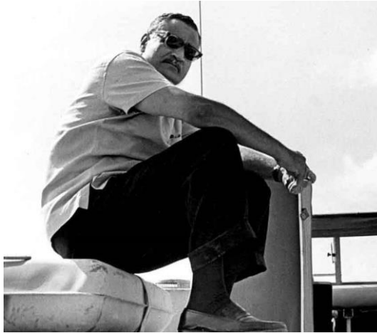
عبد الناصر فى جبهة قناة السويس

وتفادياً للتوتر، فقد توجهت جمهورية الصومال الديمقراطية بتصريح الى إثيوبيا وكينيا؛ أعلنت فيه عن عزمها على تأييد علاقات ودية مع البلدان المجاورة، وعلى حل جميع الخلافات بطرق سلمية. فالحكومة السوفيتية قد أعربت لحكومتي إثيوبيا وكينيا، عن رأيها الإيجابى فى المبادرة التى تقدمت بها القيادة الصومالية الجديدة، فى شأن تسوية العلاقات مع الدول المجاورة.