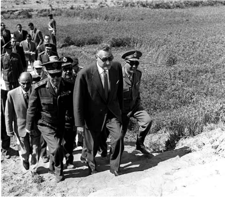
عبد الناصر على جبهة قناة السويس ١٩٦٨/٣/٥

مع الدول المجاورة. واسترشدت الحكومة السوفيتية في ذلك برغبتها في تعزيز السلام في هذه المنطقة من افريقيا وفي تقوية المركز الدولي لجمهورية الصومال الديمقراطية. وبالنظر الى العلاقات الودية التقليدية بين الصومال والجمهورية العربية المتحدة والتأييد الكامل من جانب الصومال لقضية الشعوب العربية العادلة في نضالها ضد العدوان الاسرائيلي وكذلك نظرا للاتجاه التقدمي للحكم الجديد في الصومال فإن الحكومة السوفيتية تعبر عن أملها في ان حكومة الجمهورية العربية المتحدة سوف تتمكن بالامكان من اتخاذ الخطوات التي ستراها مناسبة بهدف تدعيم النظام في جمهورية الصومال الديمقراطية وتوطيد مواقعها السياسية في الميدان الدولي. وستكون الحكومة السوفيتية ممتدة على حصولها على الأفكار والآراء المحتملة في هذا الشأن من جانب حكومة الجمهورية العربية المتحدة.