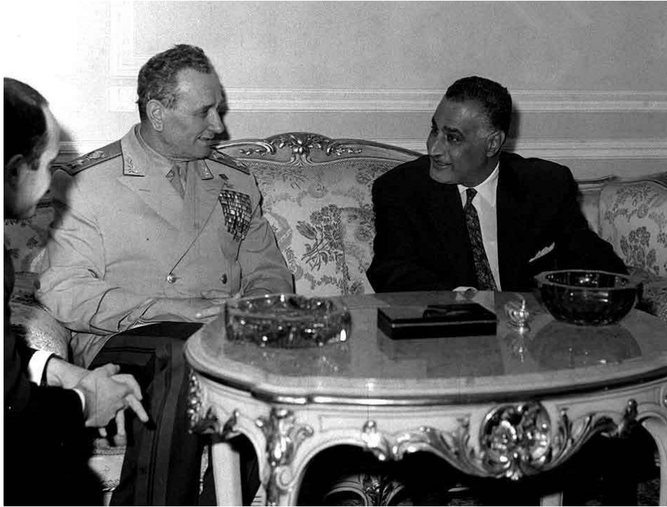
عبد الناصر يستقبل أندريه جريتشكو وزير الدفاع السوفيتي ١٩٤٨/٤/١

ونرجو أن نعرف السيد الرئيس، هل ترون من الممكن تقديم تنبيه مماثل من جانبكم الى حكومة بريطانيا؟