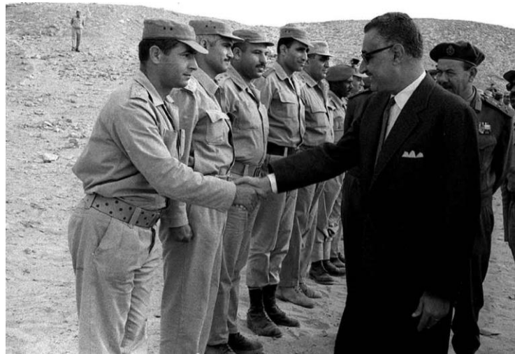
زيارة عبد الناصر للجبهة في ثاني وثالث أيام عيد الاضحى ١١/٣/١٩٦٨

وأشار الجانبان إلى ضرورة وحدة أعمال جميع الدول العربية، وتوسيع التأييد من جانب القوى المعادية للاستعمار لكفاح العرب من أجل إزالة آثار العدوان، وفي سبيل إعادة في الشرق الأدنى سلام دائم مبنى على احترام الحقوق الشرعية للشعوب العربية.