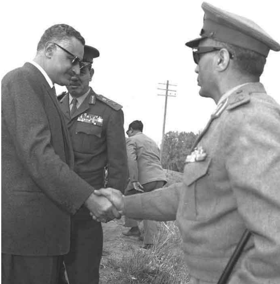
عبد الناصر مع وزير الحربية ورئيس الأركان على جبهة قناة السويس ١١/٣/١٩٦٨

وقال جولدمان: إنه على يقين أن الولايات المتحدة تملك الوسائل لإقناع اسرائيل؛ حتى تتخذ خطا "متوسطا عاقلا". إن المشكلة الأساسية في هذا هي: الى أي درجة نيكسون شخصيا مستعد للقيام بهذه الخطوة، إذا أخذنا بعين الاعتبار أن النفوذ اليهودي في الولايات المتحدة نفسها لايزال عاملا هاما في الحياة السياسية الأمريكية الداخلية.